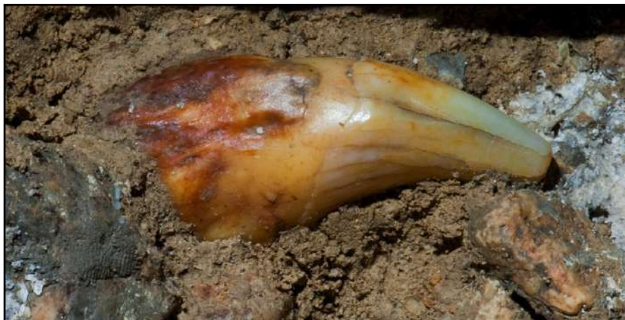
Takhle vypadá špičák jeskynního medvěda poté, co si jej dvacet tisíc let nečistil.