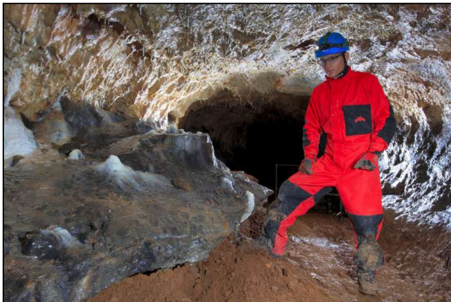
Nízka chodba ve Výpustku