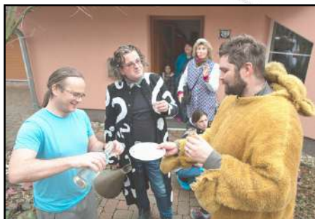
Údržba medvědího čenichu