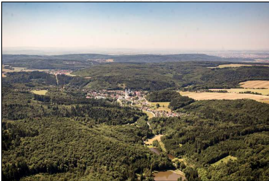
Krása a rozlehlost lesů ŠLP Křtiny