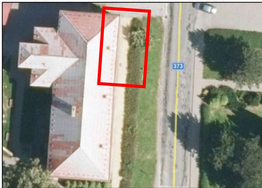
Poloha původního obecního domku č. p. 65 na podkladě dnešního Spolkového domu, který jej v roce 1901 nahradil (letecký snímek mapy.cz).