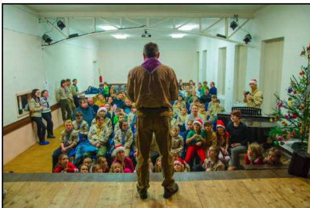
Vánoční besídka 2022