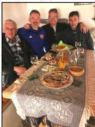
Mozkový trust Sokola rozjímá nad kalendářem akcí.