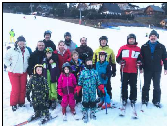
Jádro výpravy na Malou Morávku zahrnuje všechny věkové i výkonnostní kategorie.