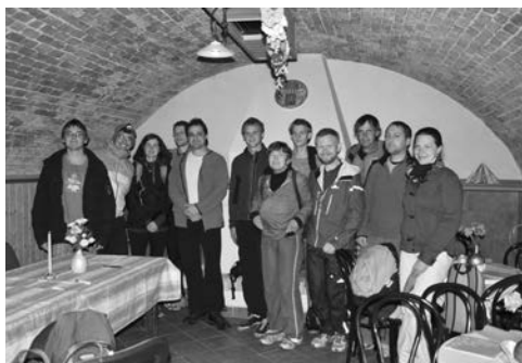
Na startu stovky

Tento ročník turistického pochodu Křtinská padesátka byl v mnohém výjimečný. Po pěti letech byly nachystány nové trasy, které vycházely z původních ročníků pochodu v 70. letech a měly i novou kilometráž o délkách 10, 20, 30, 40 a 50 km. Jejich přípravu měl na svědomí Petr Švenda starší. Druhou novinkou byla mimořádná trasa 100 km, která byla uspořádána