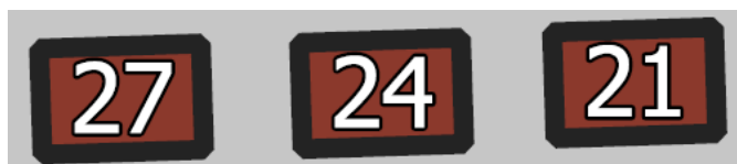
Obr. 2 Ukázka zakreslení urnových míst v kolumbáriu na mapě hřbitova