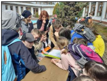
Den Země - den jídla.