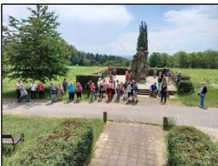
... a také nedokončená Masarykova rozhledna. Chvilku nám uvnitř trvalo, než jsme zjistili, že jde o pietní místo. Padlým se omlouváme.