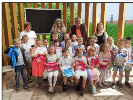
Pasování předškoláků na prvňáky