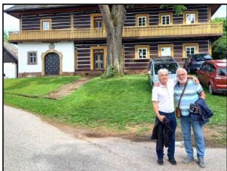
Starostové Kruhu a Křtín před kružskou dominantou. K neroznání.