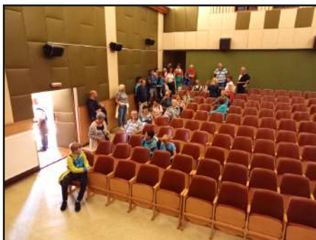
Tak tohle jim fakt závidíme.