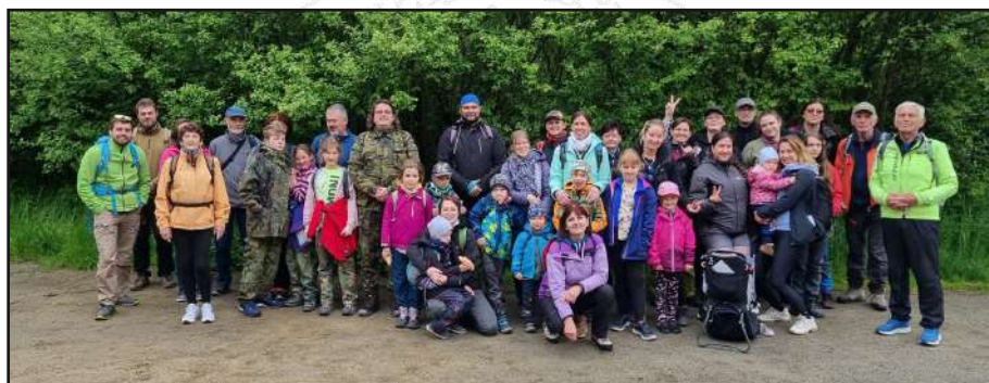
Sokol, to je především mládí. Rezervoár křtinské budoucnosti.