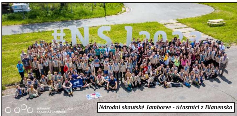
Národní skautské Jamboree - účastníci z Blanenska