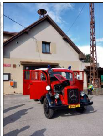
Chloubka kružských hasičů.