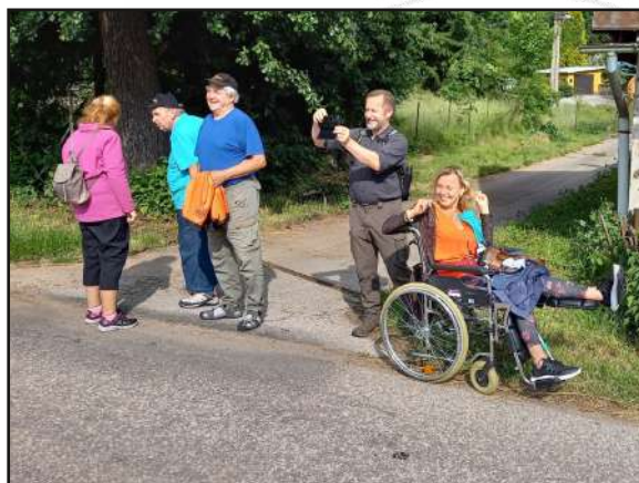
Točíme se v Kruhu.