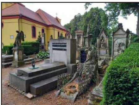
Hořice, to nejsou jen slavné trubičky, ale hlavně pískovec a sochy...