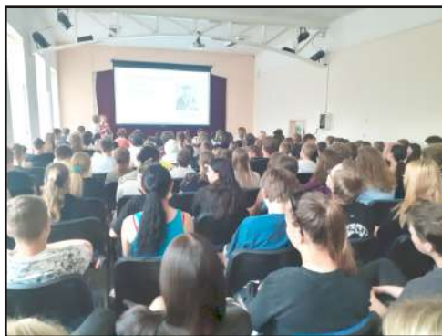
Prezentace prací absolventů