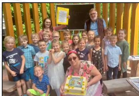
Pasování prvňáků na čtenáře