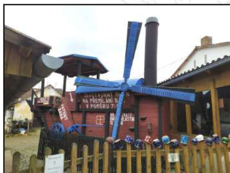
Kolovečský mlýn na baby (včetně návodu k použití)