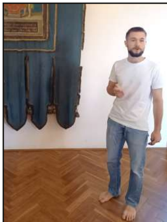
Více takových průvodců, jako má hrad Pecka.