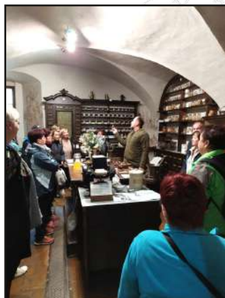
Barokní lékárna v Klatovech