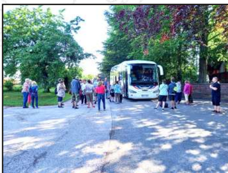
Ranní odjezd z pensionu Trautenberk v Rovnáčově, nedaleko Staré Paky. Náš příští cíl: hrad Pecka.