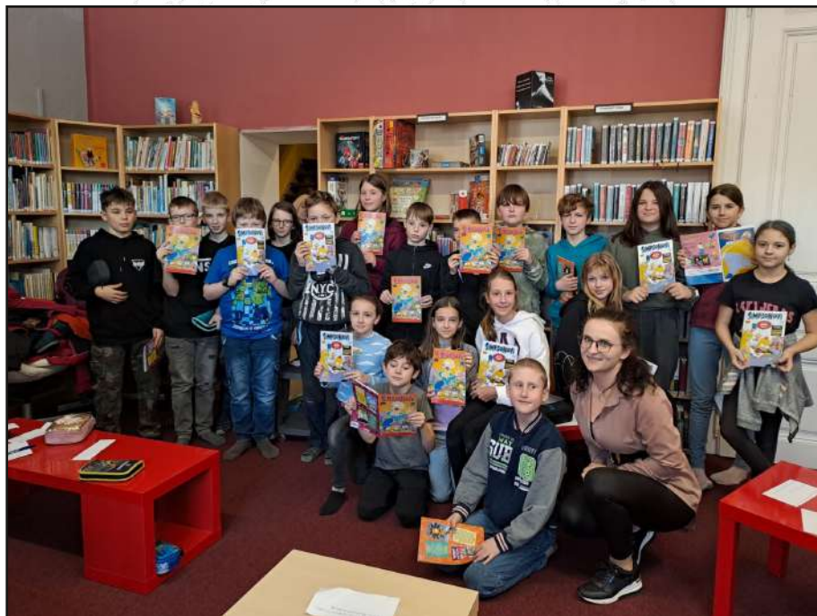
„Sněhurka a třikrát sedm trpaslíků.“

Marie Slaničková knihovna Městysu Křtiny