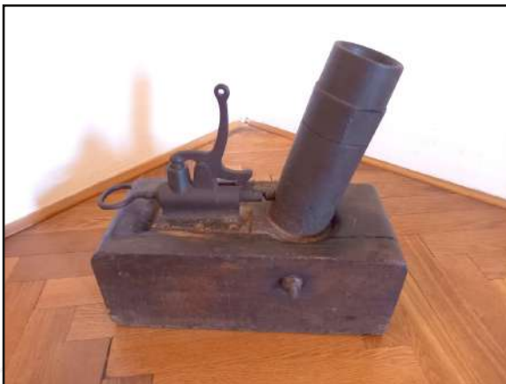
Tohle jsme na hradě našli. Že nevíte, co to je? Je to sice čirá náhoda, ale odpověď najdete ve fejetonu.