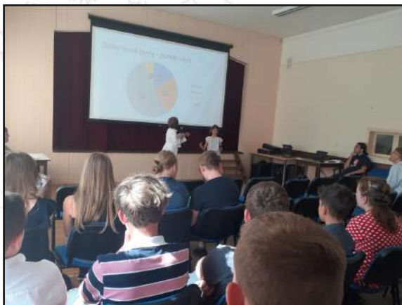
Ekologická konference na téma: Co dělat, abychom nedopadli, jako ten pravěký ještěř.