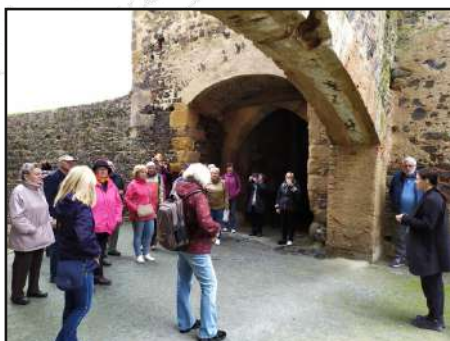
STP na Švihově