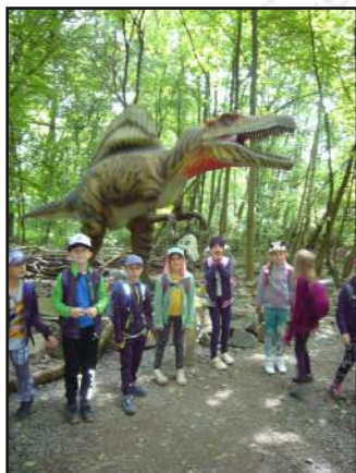
Pravěký ještěř jde do školy v přírodě.