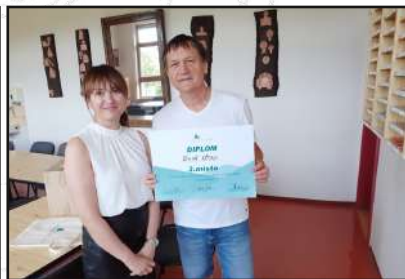
Sběr papíru: třetí v republice!