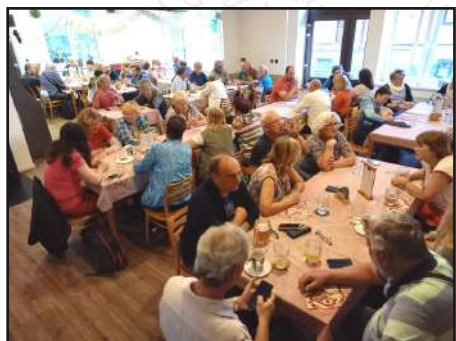
„Tá Kružská hospoda, je pěkně stavěná.“ Kružané se nám v ní vzorně věnovali až do večera.